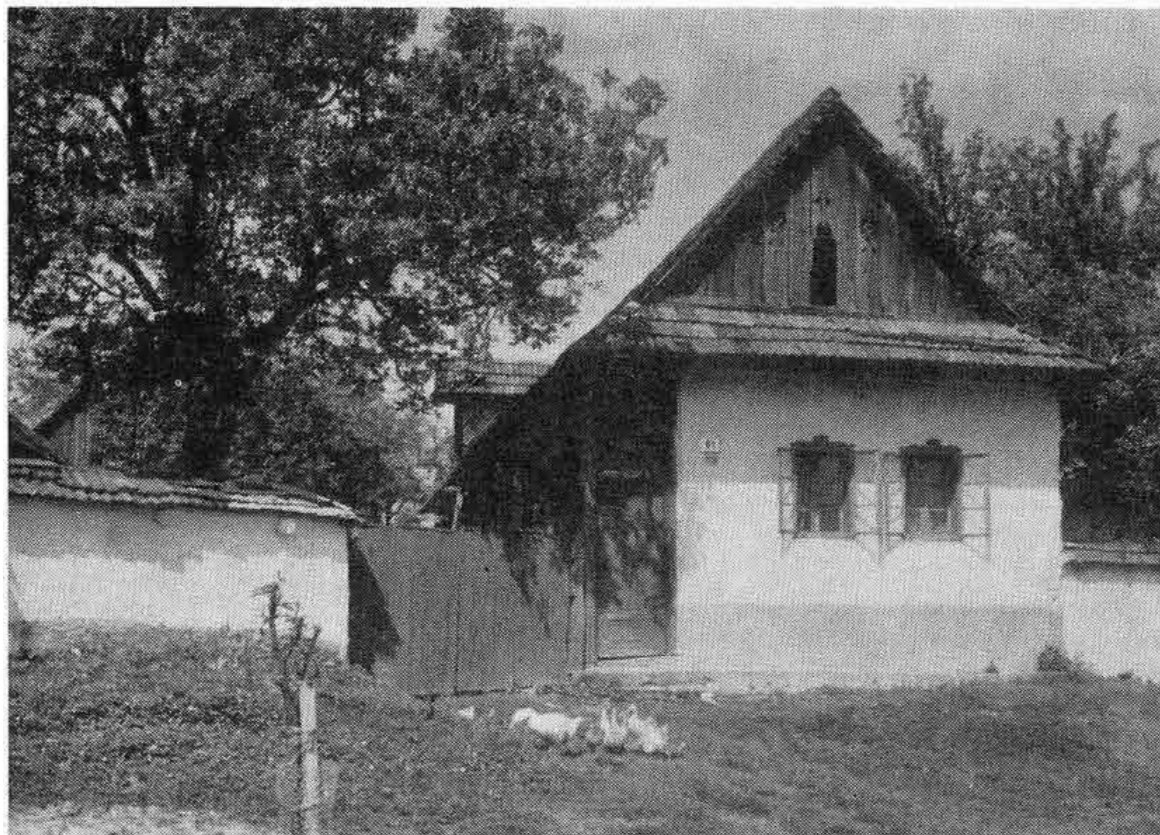
Tradičný obytný dom s vyrezávaným štítom a ozdobnými nadokennými lištami. Sebechleby. Foto V. Gosiorovský 1978. NÚ SAV