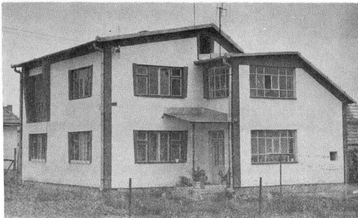
Nový typ obytného domu postavený po druhej svetovej vojne. Sebechleby.