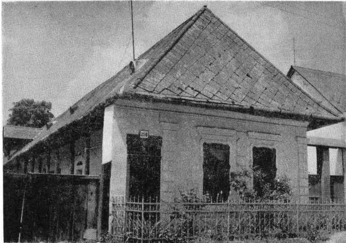
Priečelie tradičného obytného domu čiastočne upraveného po druhej svetovej vojne. Sebechleby. Foto V. Branko 1977. NÚ SAV