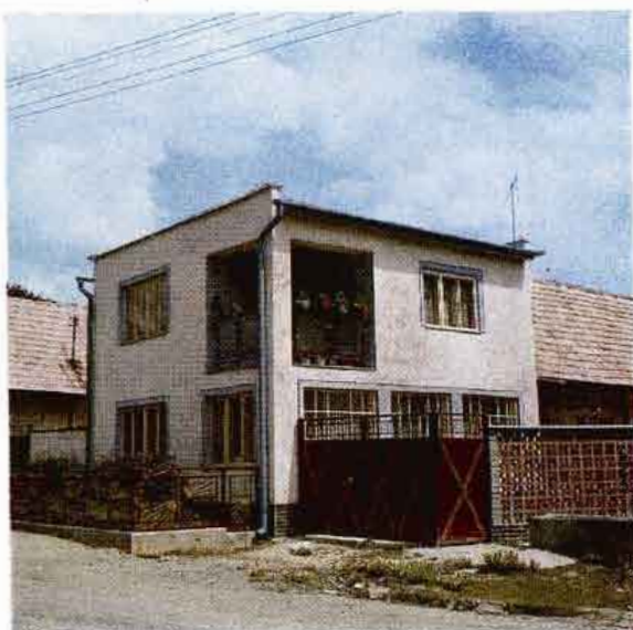
Najnovší typ štvorcového obytného domu s rovnou strechou. Sebechleby. Foto A. Pranda 1977. NÚ SAV