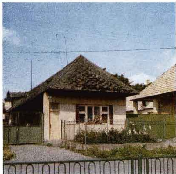
Typ tradičného domu po druhej svetovej vojne čiastočne prestavaný. Sebechleby. Foto A. Pranda 1977. NÚ SAV