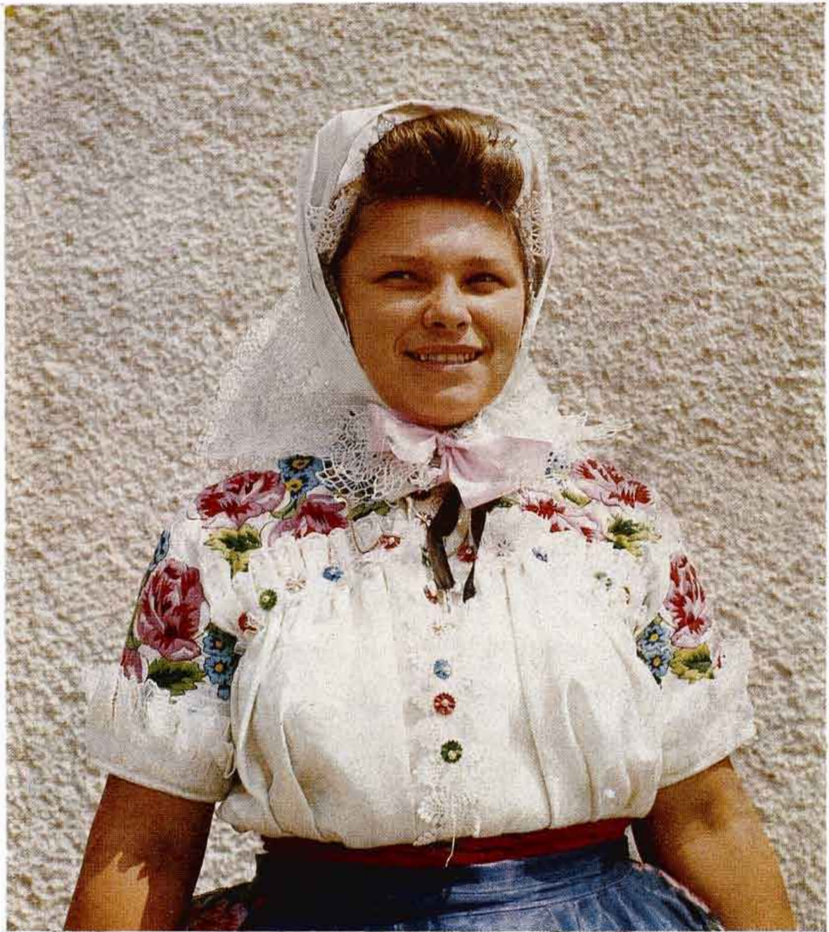
Tradičný odev mladých žien. Sebechleby. Foto A. Pranda 1977. NÚ SAV

Nový typ štvorcového obytného domu s rovnou strechou postavený v 70. rokoch 20. storočia. Sebechleby. Foto A. Pranda 1977. NÚ SAV ►